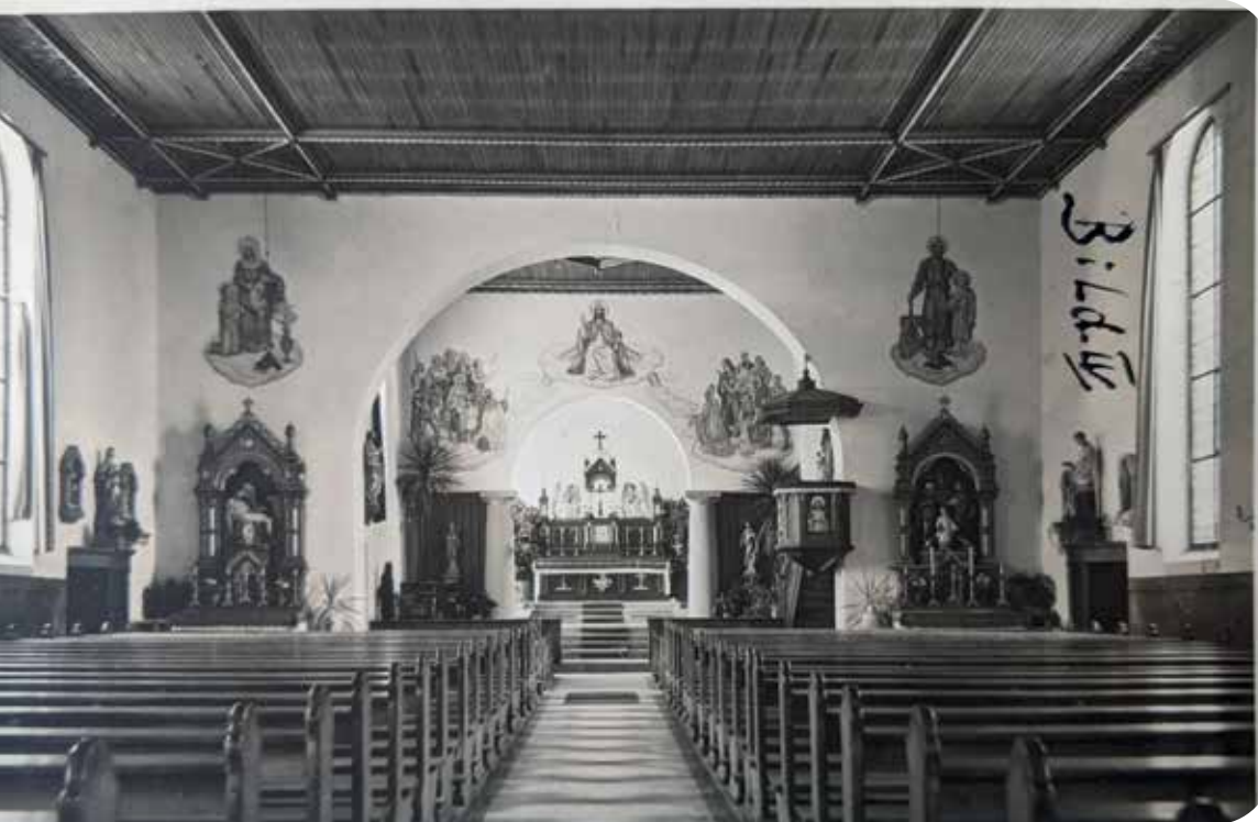
Archivbild von ca. 1938

wurde durch die Bulle "Provida solersque von Papst Pius VII. die Erzdiözese Freiburg formell errichtet, als offizielles Gründungsdatum gilt aber der 21. Oktober 1827, der Weihetag des ersten Freiburger Erzbischofs. Als Baumaterial für die neue Kirche in Ottenhöfen im Weinbrenner-Stil wurden dann auch Teile des Klosters Allerheiligen verwendet. Bei einer Länge von 40 Metern und einer Breite von 14,5 Metern bot sie etwa 500 Sitzplätze für die Gottesdienstbesucher und wurde dem seligen Markgrafen Bernhard von Baden und der heiligen Mutter Anna geweiht.