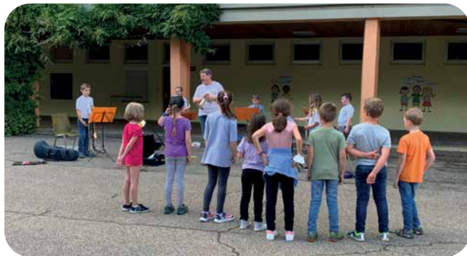
Musikerinnen und Musiker der Dorfmusik Furschenbach und der Kurkapelle Ottenhöfen assistierten beim Instrumentenkarussell. Sie zeigten den zukünftigen Schülern einige Tipps und Tricks und freuen sich bereits jetzt auf den Nachwuchs

Am 29. Juni war es endlich so weit: Die Schülerinnen und Schüler der Erwin-Schweizer-Grundschule spielten ihre ersten Töne auf ihrem Wunschinstrument, das sie nach den Sommerferien in der Bläserklasse erlernen werden. Stolz präsentierte zu Beginn des Abends die aktuelle Bläserklasse ihr Können und drückte u.a. mit der Nationalhymne der deutschen Nationalmannschaft die Daumen für das Achtelfinale der Fußball-EM. Aber nicht nur im gemeinsamen Ensemblespiel, sondern auch als Solisten zeigten die jungen Musikerinnen und Musiker, was sie bereits auf ihrem Instrument alles drauf haben. Anschließend schnupperten die interessierten Schüler der ersten und zweiten Klasse an den verschiedenen Stationen und testeten Holz- und Blechblasinstrumente unter den vorgegebenen Hygienevorschriften.