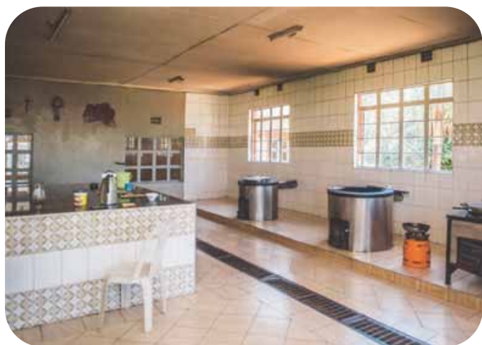
Eine tolle Küche hat das Waisenhaus Malaika Childrens Home erhalten, sie wurde jüngst fertiggestellt