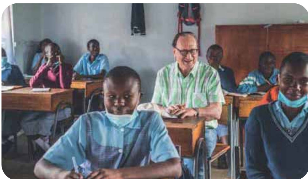
Seit Beginn des Jahres hat im Waisenhaus des Vereins Afrikanische-Deutsche Partnerschaft Malaika e. V. die Schule wieder begonnen, die Kinder freuen sich