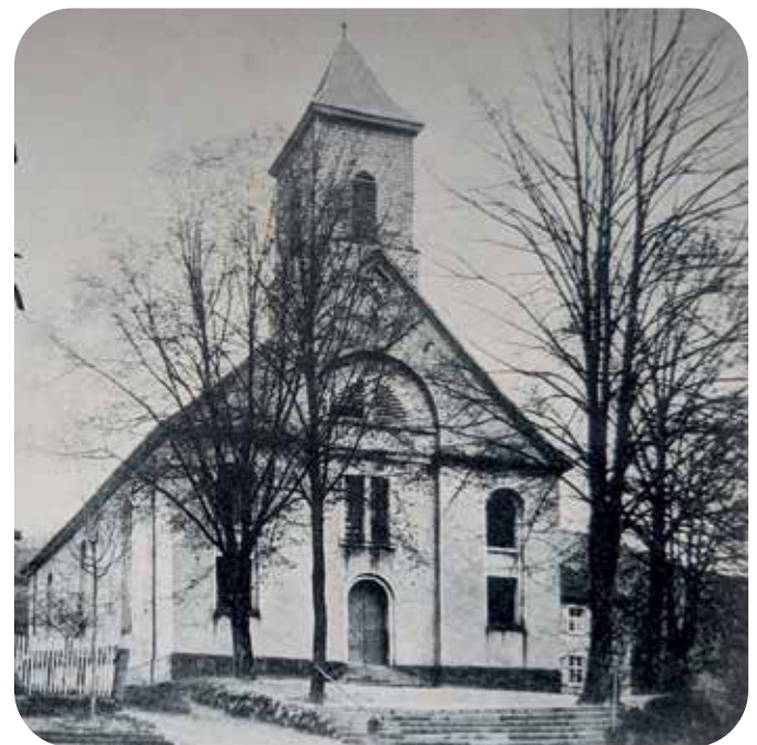
Archivbild von ca. 1910