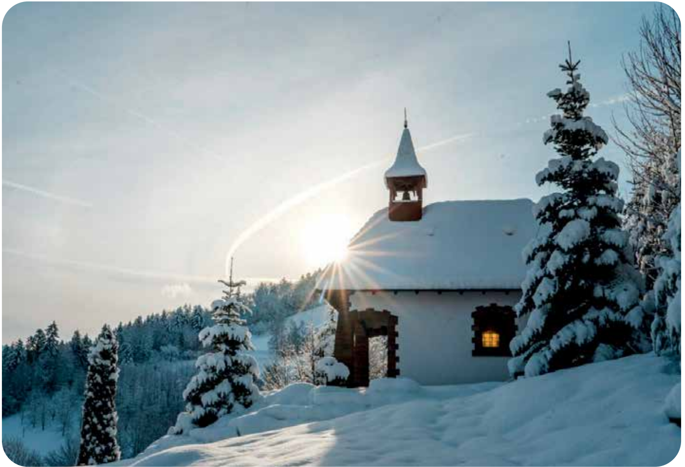
Bernhardus-Kapelle im Lauenbach