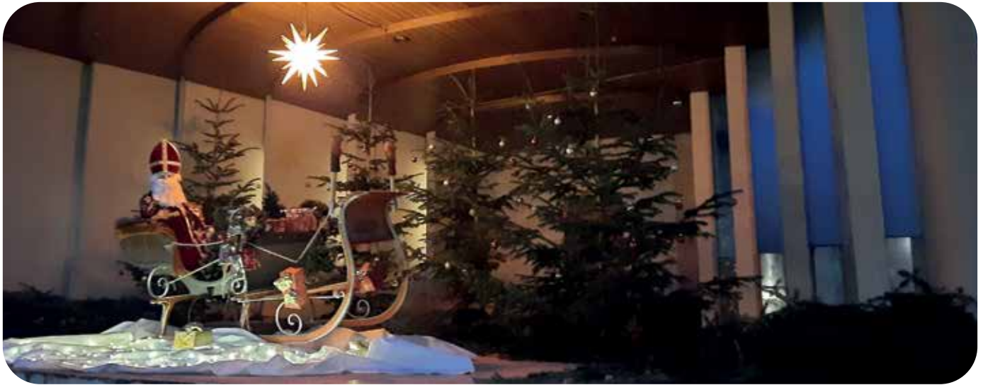
Das Mühlenbauer-Team der Trachten- und Volkstanzgruppe hat den Nikolaus ins Mühlendorf eingeladen